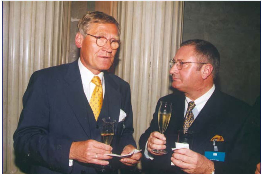
V. l. n. r.: Witten, Aden