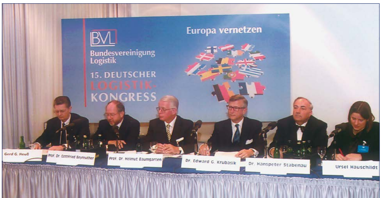
Pressekonferenz während des 15. Deutschen Logistik-Kongresses