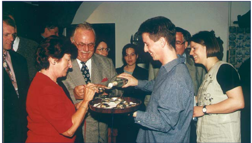
Der traditionelle Löffeltrunk zur Begrüßung im Mittelsbürener Bauernhaus

Die BVL lädt anlässlich des Jubiläums „20 Jahre BVL“ zum Abendempfang in das Mittelsbürener Bauernhaus des Focke-Museums ein zu köstlichem Buffet und Musik von den „New Orleans Feetwarmers“ im Altbremer Ambiente. Eine Führung durch die neue Ausstellung „Bremische Geschichte“ ergänzt das Treffen der „Logistics Family“ der BVL.