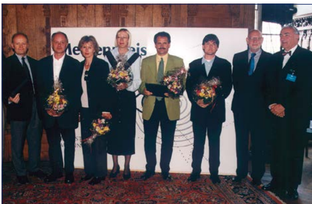
Preisträger des Medienpreises Logistik