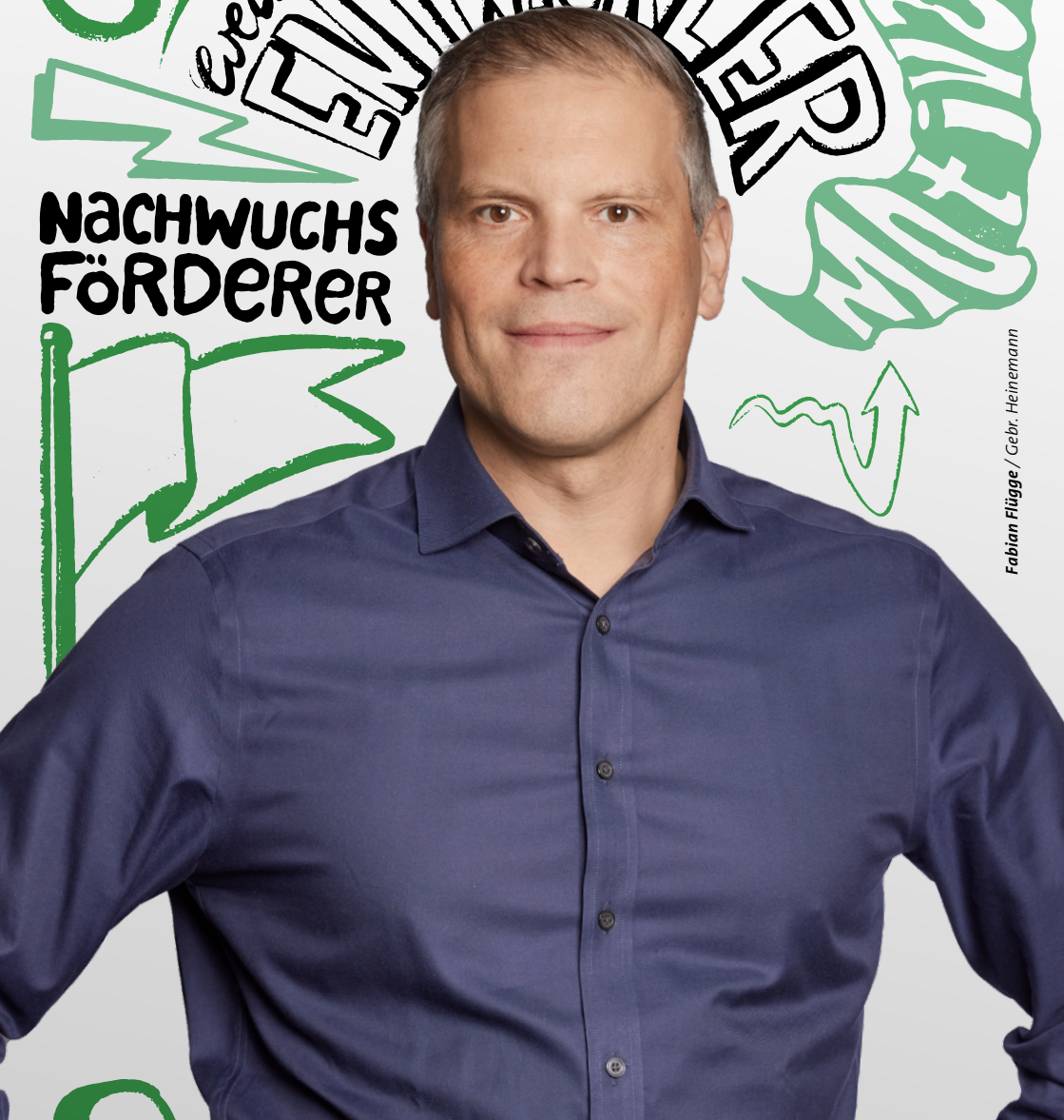
Fabian Hilgke / Gebr. Heinemann