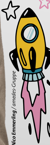
Nico Emmerling / amedes-Gruppe